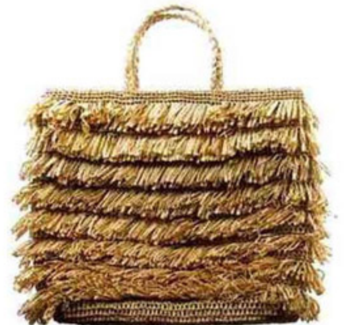
Cabas en raphia, Le Printemps, 49 euros.