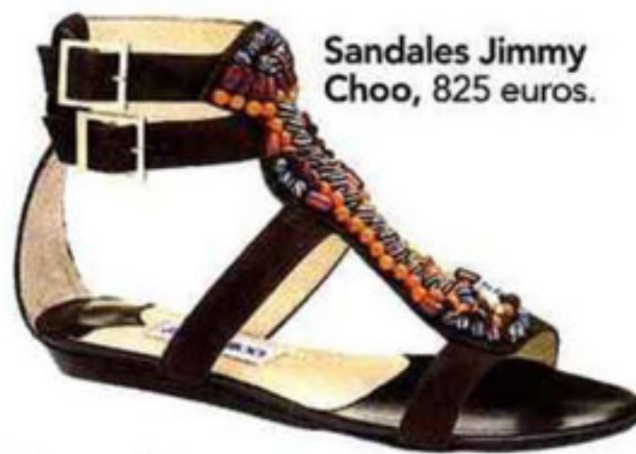
Sandales Jimmy Choo, 825 euros.