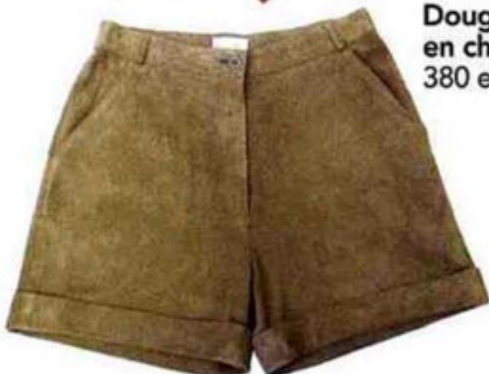
Short Mac Douglas en chèvre, 380 euros.