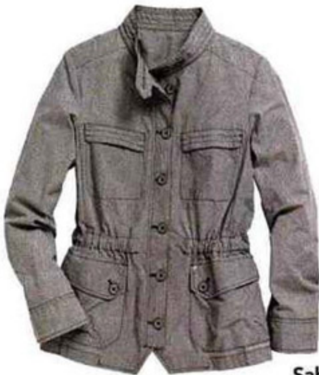
Saharienne New Man, 230 euros.