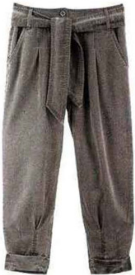
Pantalon carrot Xanaka, 39,95 euros.