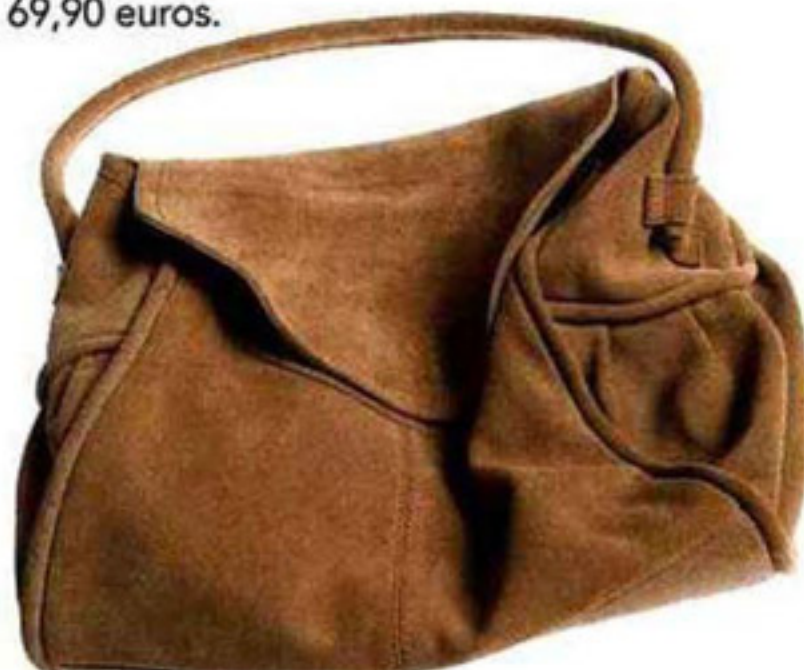
Sac en daim H&M, 69,90 euros.