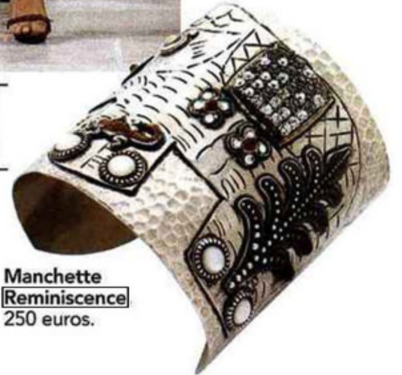
Manchette Reminiscence 250 euros.