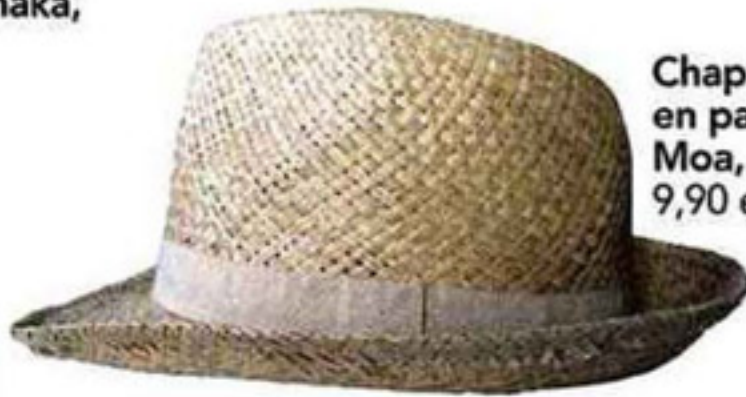
Chapeau en paille Moa, 9,90 euros.