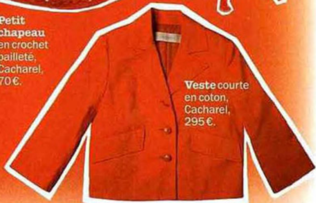
Veste courte en coton, Cacharel, 295€.