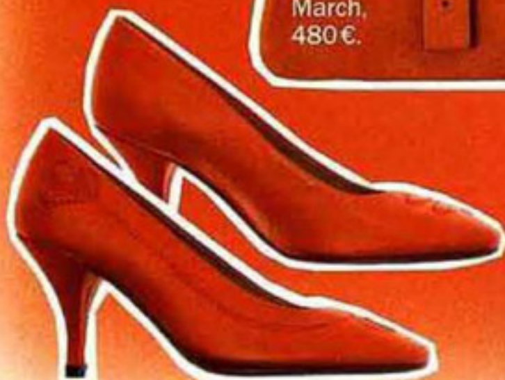
Escarpins en cuir à surpiqures, Estelle Yomeda, 280€.