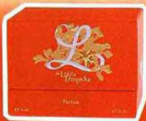
Eau de parfum Fleur de corail, Lolita Lempicka, 64€ les 50 ml.