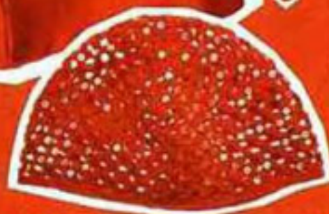
Petit chapeau en crochet pailleté, Cacharel, 70€.