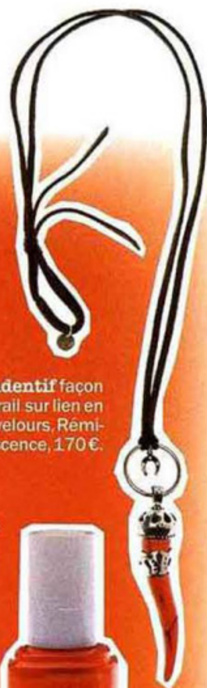
Pendentif façon corail sur lien en veau velours, Rémiscence, 170€.