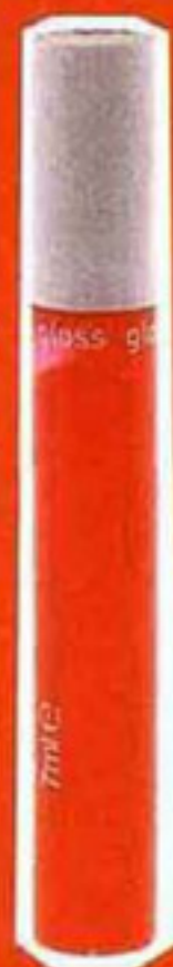
Gloss, Monoprix Beauté, 3,90€.