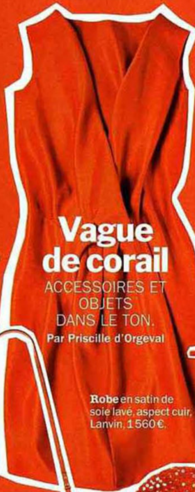
Robe en satin de soie lavé, aspect cuir, Lanvin, 1560€.

ACCESSOIRES ET OBJETS DANS LE TON. Par Priscille d'Orgeval