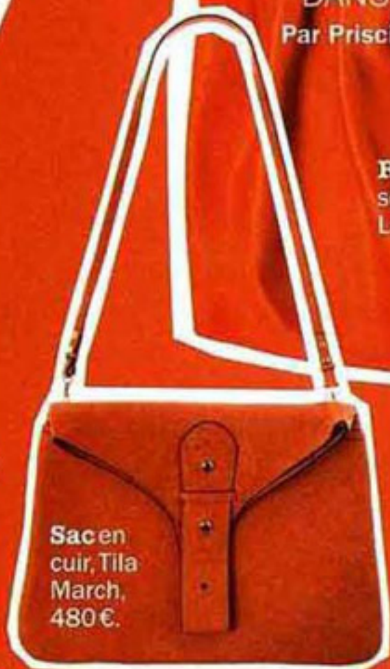
Sac en cuir, Tilla March, 480€.