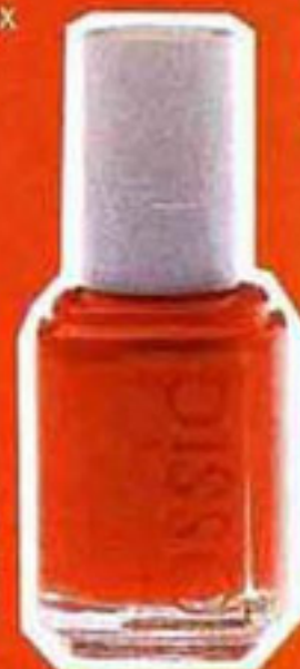
Vernis à ongles, Essie, 12€.