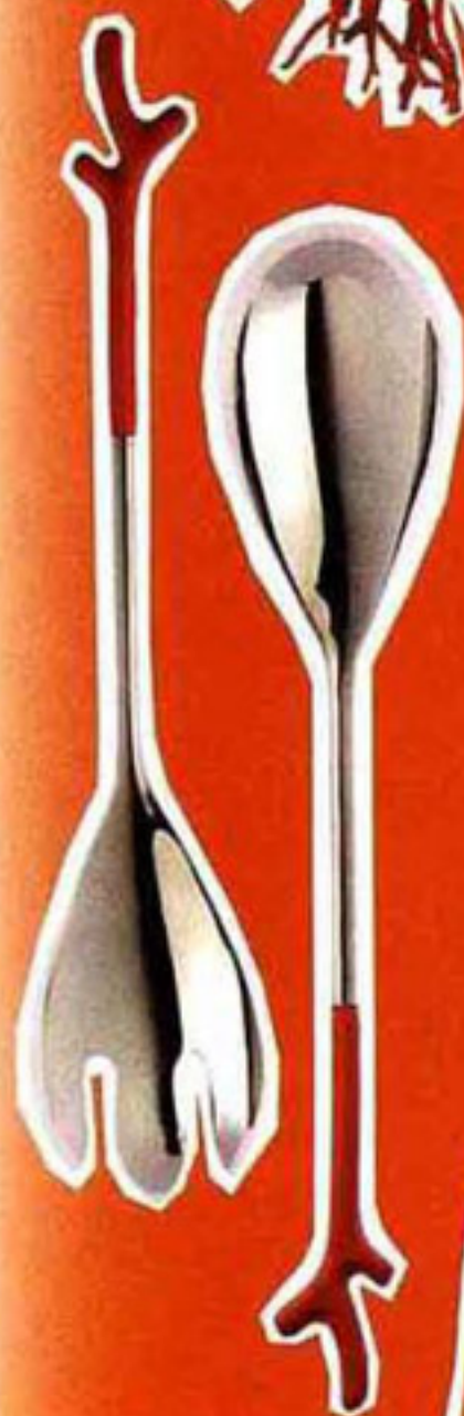
Couverts à salade manches en céramique, Fragonard, 24€.