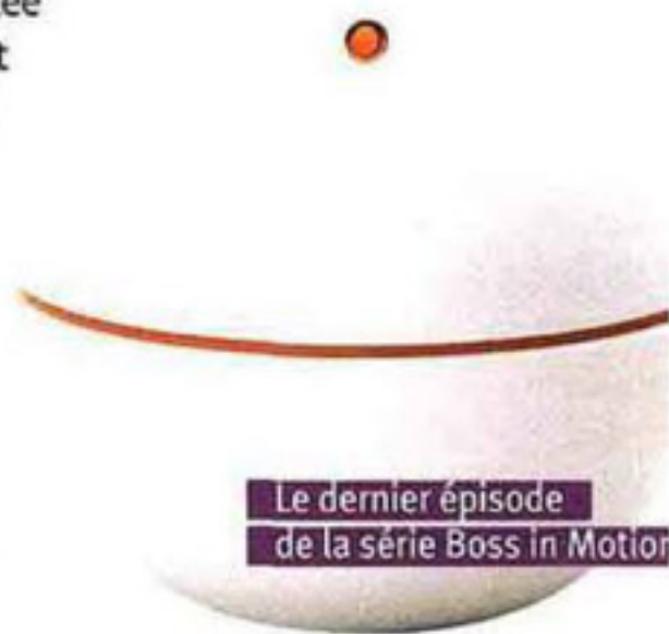
Le dernier épisode de la série Boss in Motion

White Edition, EdT spray 40 ml (46 €) et 90 ml (63 €), gel douche 150 ml (20 €). En mai. Parf., GM.